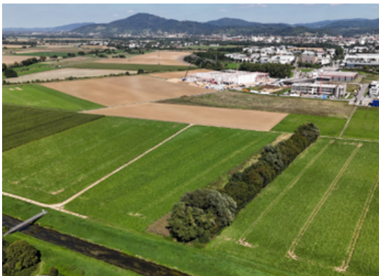
Lorsch und Bensheim planen ein gemeinsames Gewerbegebiet: Fläche östlich der Weschnitz

Im Jahr 2025/26 boten wir eine breite Palette öffentlicher Veranstaltungen an, darunter einige zum Themenbereich Klimaschutz. Auch in 2026 wird es wieder vielfältige Angebote zum Mitmachen geben.