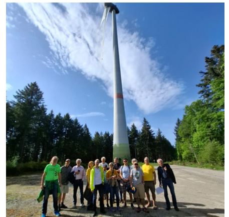
03.05.25: Exkursion zum Windpark Greiner Eck im Neckartal mit vielen Bensheimer Interessierten