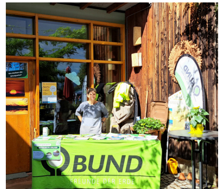
30.08.25: Infostand im Naturschutzzentrum