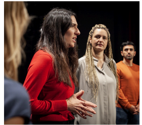
14.06.25: Ein erfolgreicher Versuch - die Theateraufführung "Klimamonologe" im Heppenheimer Saalbau