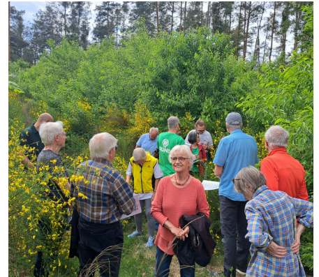
16.05.25: Besichtigung der Eichenpflanzung aus lokalem Saatgut im Viernheimer Wald