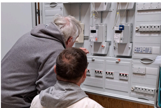
16.09.2025: Besuch der PV-Anlage des BUND

Gemeinsam mit Nabu, DGB und dem Paritätischen haben wir eine Podiumsdiskussion zur Kommunalwahl ausgerichtet – die einzige im Kreis. Themen waren Klimaschutz, Biodiversität, Arbeit und Soziales.